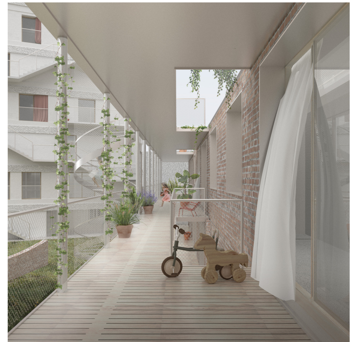
> Vista ballatoi < Pianta PT, 1:200