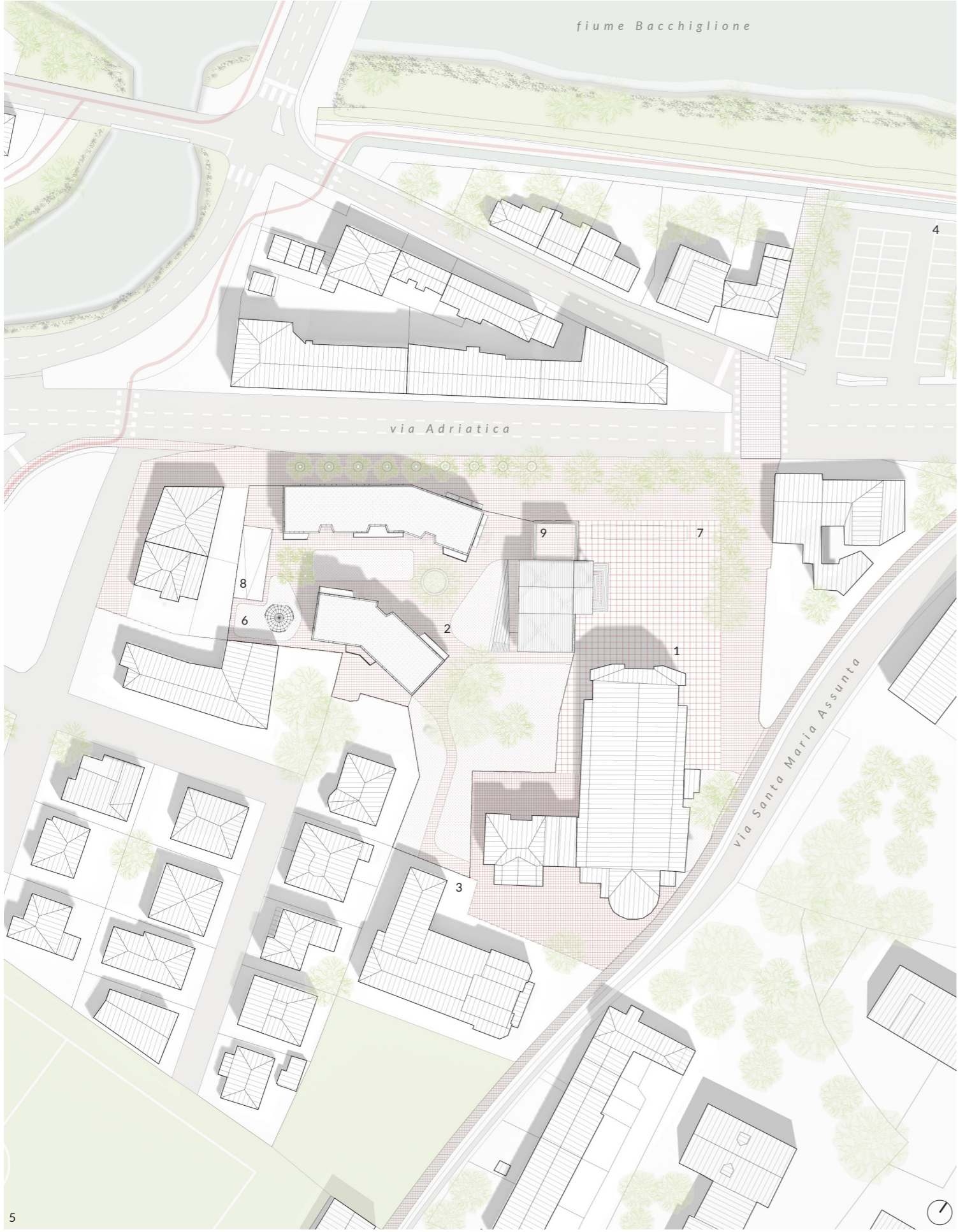
PLANIMETRIA GENERALE | 1:1.000